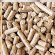
pelety z řepky