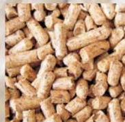
dřevní pelety s kůrou