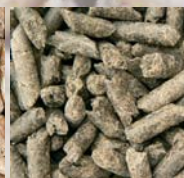
pelety ze slunečnice